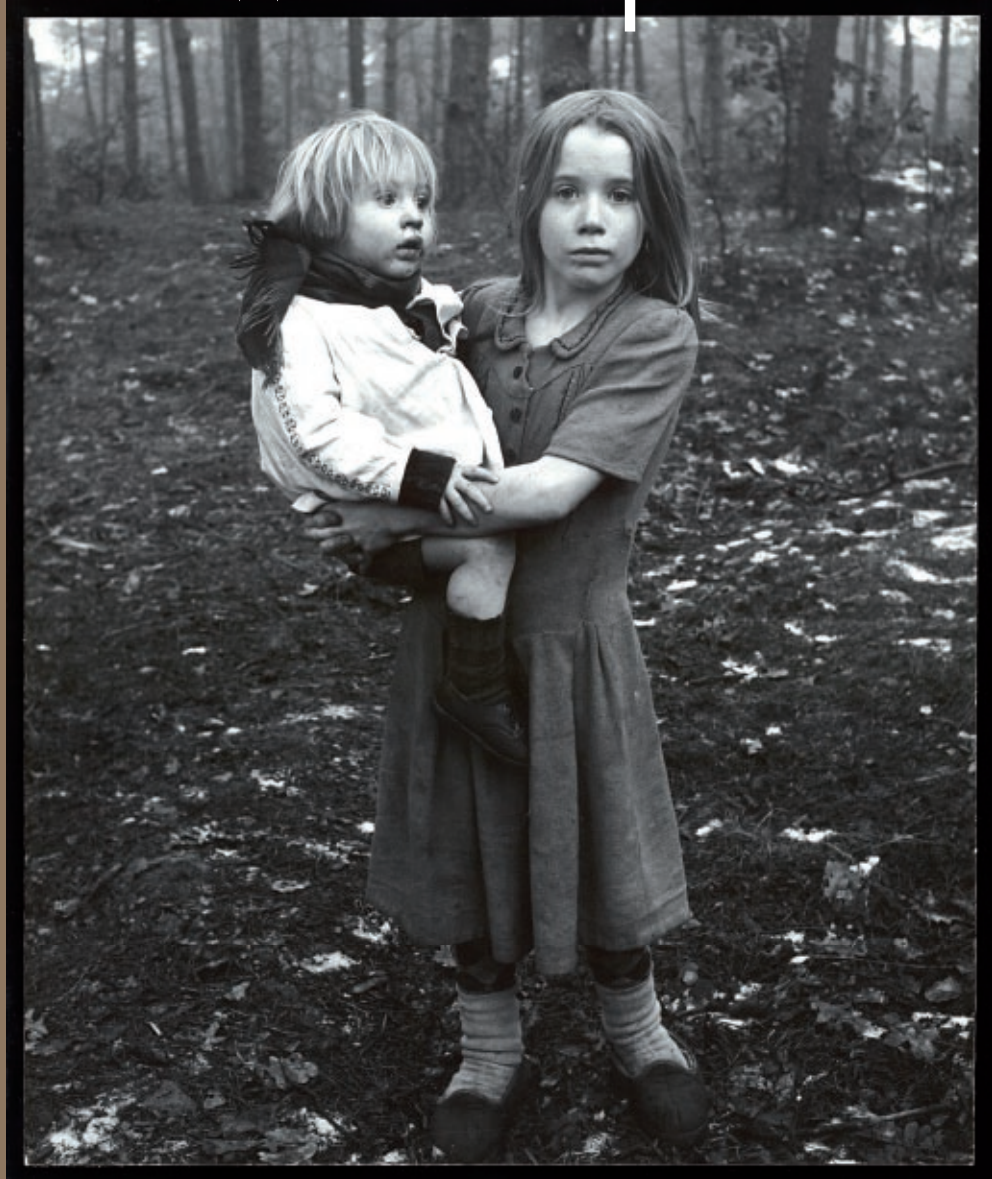
Martien Coppens, 'Meisje met jong kind op arm' - Brabant-Collectie/VLT - © Nederlands Fotomuseum