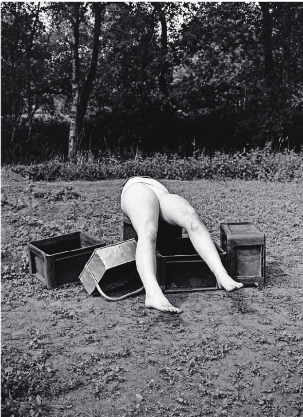
▲ Blauwe plek, 2023.