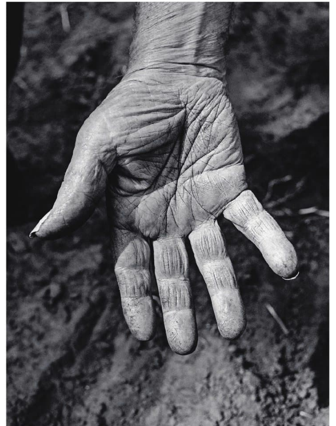
▲ Hand, 2023.