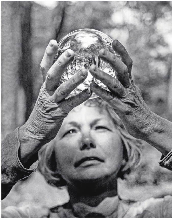
▲ Hemeldraagster, 2023.