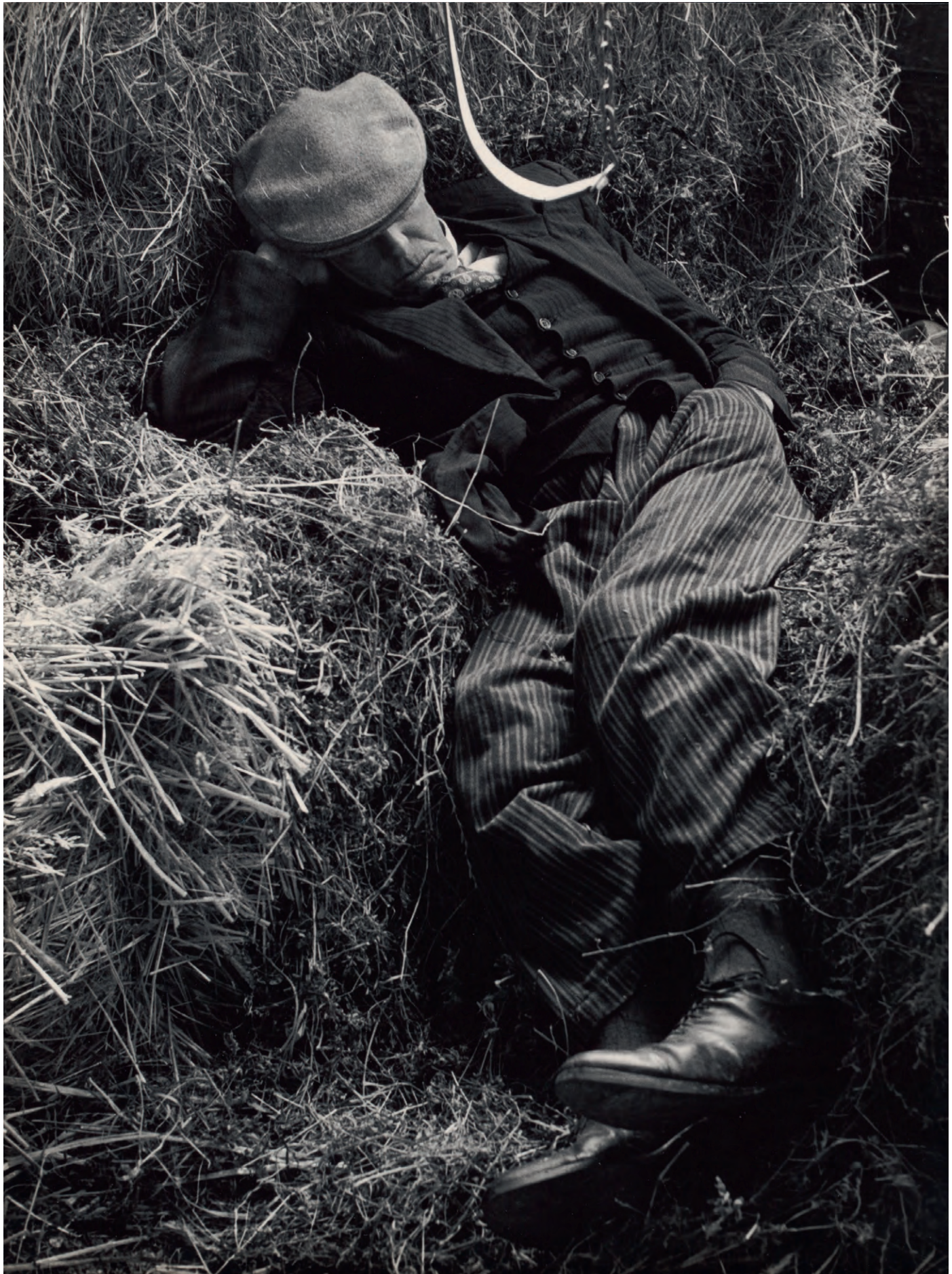
▲ Slapende man in het stro op de veemarkt in 's-Hertogenbosch, circa 1950-1956.