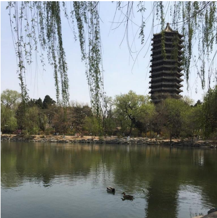
Weiminghu Lake op de campus van Peking University