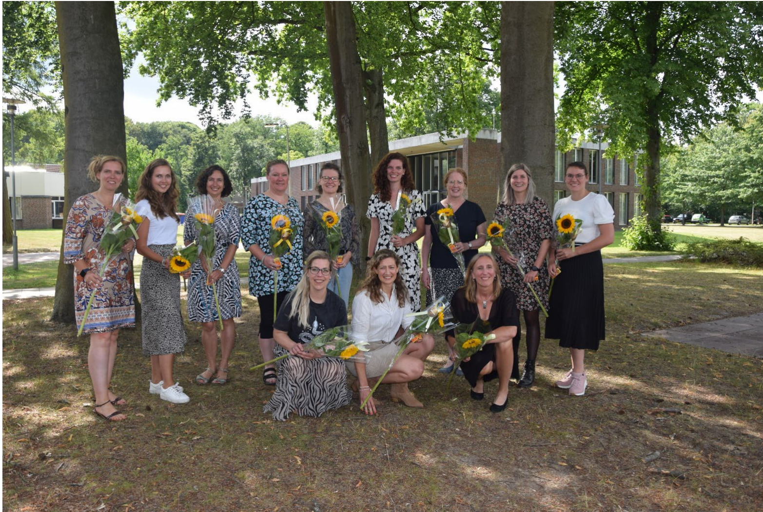
Kick-off symposium 14 juli 2022