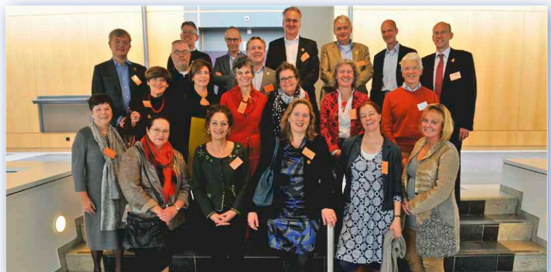
The Class of 1986

Daarna volgde een rondleiding over de campus die eindigde in het stiltecentrum, nu Zwijsen-building. Daar informeerde emeritus hoogleraar Joop Vianen de alumni over Professors for Development. De zeer geslaagde dag werd afgesloten tijdens de Dies-borrel waar de alumni enkele oud-docenten tegen het lijf liepen. Een gewaardeerde nieuwe traditie, die we volgend jaar zeker zullen voortzetten.