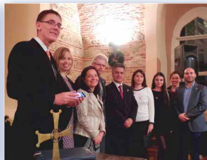
Opening Alumni Chapters in 2013 vlnr: China januari, Colombia november, Turkije november