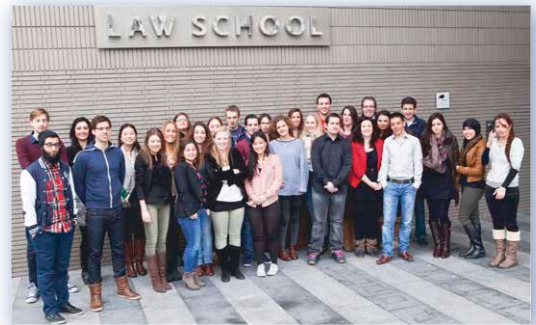
Belteam 2013 Tilburg Law School

Van 25 februari tot en met 23 maart 2013 hield Tilburg Law School haar vierde belcampagne. Een team van enthousiaste rechten & bestuurskunde-studenten belde in de avonduren en op zaterdag met onze alumni. De studenten praatten de alumni bij over het reilen en zeilen bij Tilburg Law School. Ook vroegen de studenten de alumni om een bijdrage voor het Tilburg Law School Fund. De studenten hebben ongeveer 900 alumni gesproken. De gesprekken verliepen zeer geanimeerd, en zowel de alumni als de studenten gaven aan het gesprek zeer te waarderen. Ongeveer de helft van de alumni besloot tot het doen van een financiële bijdrage. Daarmee hebben de alumni tezamen ongeveer €34.000 aan het Tilburg Law School Fund bijgedragen. Dat is een fantastisch resultaat, waarmee bijzondere projecten in de wereld van het recht kunnen ondersteund.